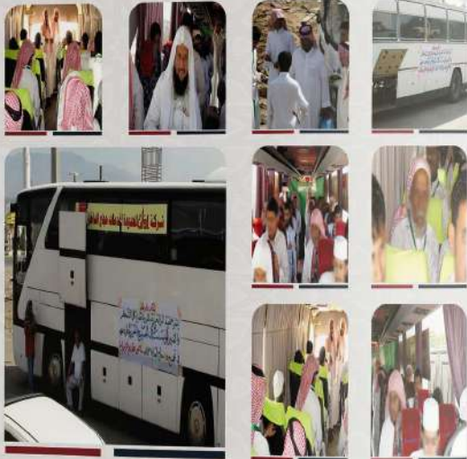
حارس من أعمال تحجج الفقراء