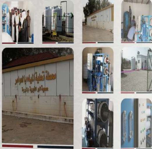
محطة تجلية المياه بالواو